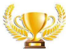
Golden School Award

Or: https://ocps.samaritan.com/custom/503/